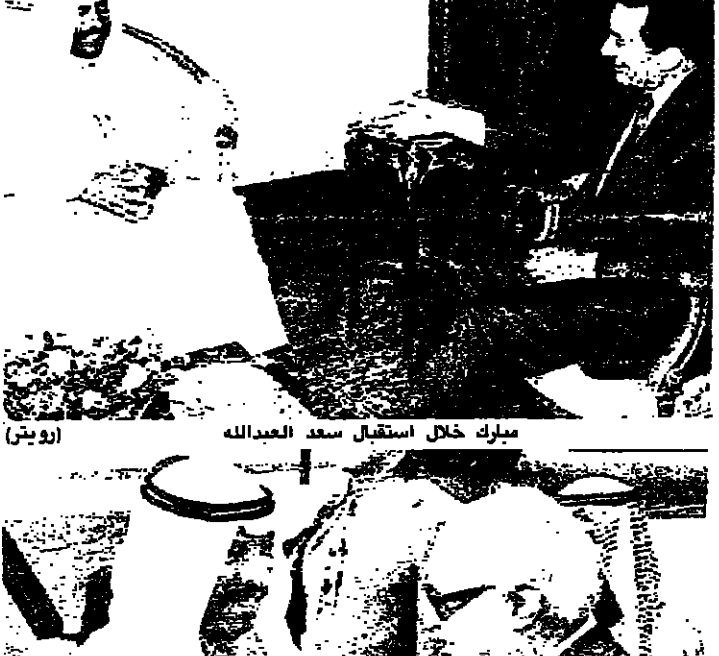
مبارك خلال استقبال سعد العبدالله (رويت)

مع دخول الاسبوع الثاني من العام وفي غياب اي معطى خارجي حسي وعلمي، يتوجه حركه ماء المعنيتين الاكثريين والنوطين الفاعلين في اتجاه لبنان، ويستند الى الموقف الفاتح، الذي يجمع المرابون على انه وان كان معنوي الا انه يبقى فاعلاً ان لم يكن الاقل. تبدو حتى الصراع السياسي الداخلي على اشدها، من خلال المواجهات السياسية والاعلامية والادارية والمالية، وما يترافق منها من توتر يومي على خطوط التماس، مما يعني بقاء الوضع اللبناني ضمن دائرة الخطر. اذا لم تطرأ معطيات جديدة، تسعى الى ضبط الامور على الساحة للقاء على المحنى السياسي للمواجهة. لان في سقوطه خطراً على مسار الوضع ككل، خصوصاً ان الساحة الجنوبية لا تزال على وضعتها، وهي لم تشهد هذوماً منذ بداية المعارك هناك، سوى هبة الساعات التسع اسبوع لاجلاء الجثث المقتولين.